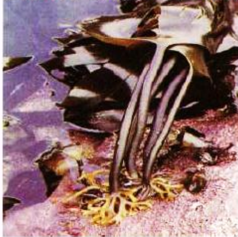
أمثلة على الطحالب البنية الفيوكس ، إكتوكاريس ، لاميناريا ، دكتيوتا

يضم قسم الطحالب البنية نحو ٢٥٠ جنس و ١٥٠٠ نوع ، اغلبها يرى بالعين المجردة، تعيش بالأعماق ، وتتميز نمواتها الخضرية بحد من المناطق المرستيمية البينية والتي تحلّي تراكيب على درجة عالية من التمييز ، ويعتبر التكتشف الخضري أكثر وضوحاً عن ما هو عليه في النباتات اللاوعائية الأخرى . تشمل الطحالب البنية على بعض النباتات الضخمة مثل الأعشاب البحرية العملاقة Giant Kelps كالإكتوكاريس والفيوكس ، والتي يصل طولها إلى ١٠٠ متر .