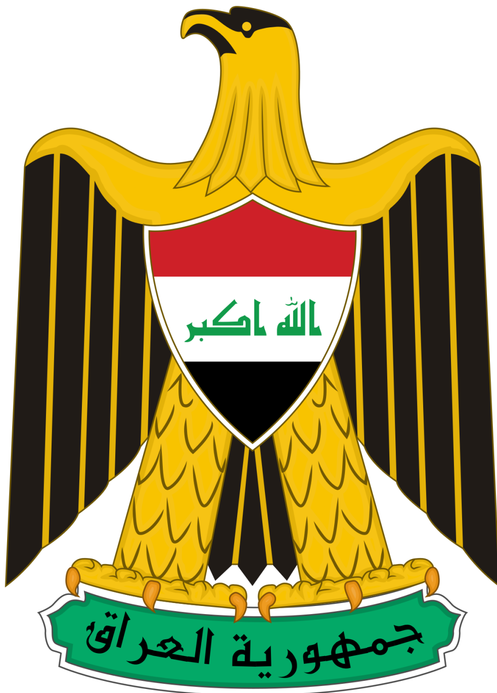
شعار جمهورية العراق