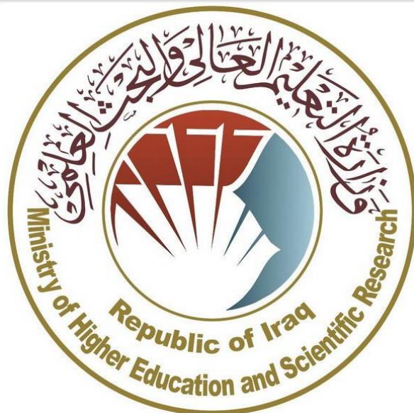
وزارة التعليم العالي والبحث العلمي