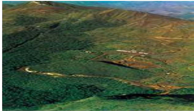
منظر جبال في منطقة بيرو غويانوية

أ - المناطق الجبلية: وهي محدودة الانتشار في البرازيل، أكثرها ارتفاعاً جبال سييرا إييري وهي تمتد على طول الحدود الشمالية مع فنزويلا، وفيها قمة نبلينا (Neblina، أعلى قمم البرازيل 3014 م)، وكذلك سلسلة جبال سييرا پكارايم (S.Pacaraima وأعلى ذراها هي قمة رورايم (Roraima) الواقعة على مثلث الحدود الغويانية - البرازيلية - الفنزويلية، أما أكثر القطاعات الجبلية أهمية وامتداداً فتقع في جنوب شرقي البرازيل، حيث تتخذ الجبال مظهر سلسلة من هضاب مرتفعة تشرف عليها مجموعة من الأعراف الحادة. وتتخذ التضاريس المتبقية مظهر ما يعرف بقوالب السكر Pains de Sucre يراوح معدل ارتفاعها بين ٢٨٩٠ متراً في قمة بانديرا (Bandeira الواقعة شمال ريو دي جانيرو، وقد حافظت غالبية هذه القمم المؤلفة من صخور قاسية على أشكالها البنيوية المقاومة لعوامل الحت والتعرية المختلفة. أما معدل ارتفاع الهضاب العالية المذكورة فيراوح بين ١٠٠٠-١٣٠٠ م وتمتد من الشمال إلى الجنوب على مسافة نحو ١٠٠٠ كم، مؤلفة حواجز جبلية تشرف على السهول الساحلية الأطلسية بجروف وسفوح شديدة الانحدار، تؤلف عقبات فعلية في وجه حركة الانتقال بين الساحل والداخل.