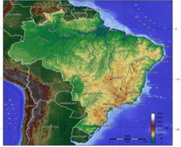
خريطة طبوغرافية للبرازيل

أ - المناطق الجبلية: وهي محدودة الانتشار في البرازيل، أكثرها ارتفاعاً جبال سييرا إييري وهي تمتد على طول الحدود الشمالية مع فنزويلا، وفيها قمة نبلينا (Neblina، أعلى قمم البرازيل 3014 م)، وكذلك سلسلة جبال سييرا پكارايم (S.Pacaraima وأعلى ذراها هي قمة رورايم (Roraima) الواقعة على مثلث الحدود الغويانية - البرازيلية - الفنزويلية، أما أكثر القطاعات الجبلية أهمية وامتداداً فتقع في جنوب شرقي البرازيل، حيث تتخذ الجبال مظهر سلسلة من هضاب مرتفعة تشرف عليها مجموعة من الأعراف الحادة. وتتخذ التضاريس المتبقية مظهر ما يعرف بقوالب السكر Pains de Sucre يراوح معدل ارتفاعها بين ٢٨٩٠ متراً في قمة بانديرا (Bandeira الواقعة شمال ريو دي جانيرو، وقد حافظت غالبية هذه القمم المؤلفة من صخور قاسية على أشكالها البنيوية المقاومة لعوامل الحت والتعرية المختلفة. أما معدل ارتفاع الهضاب العالية المذكورة فيراوح بين ١٠٠٠-١٣٠٠ م وتمتد من الشمال إلى الجنوب على مسافة نحو ١٠٠٠ كم، مؤلفة حواجز جبلية تشرف على السهول الساحلية الأطلسية بجروف وسفوح شديدة الانحدار، تؤلف عقبات فعلية في وجه حركة الانتقال بين الساحل والداخل.