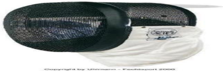
القناع الخاص للاعب المبارزة