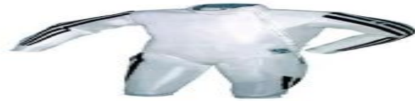
السترة للاعب المبارزة