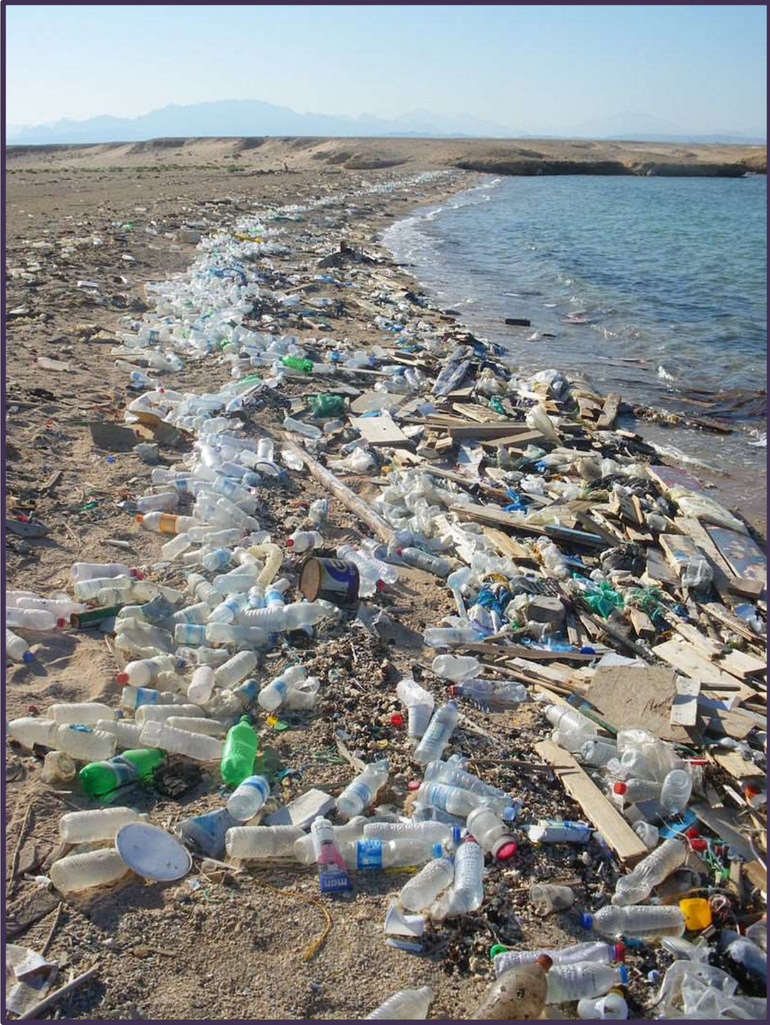
صورة توضيحية (٣) تبين تراكم اللدائن على الشواطئ