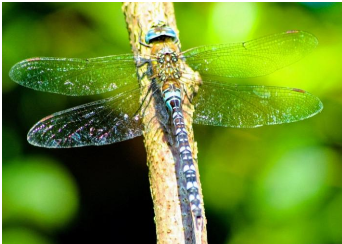
الرعاش الكبير Dragon fly