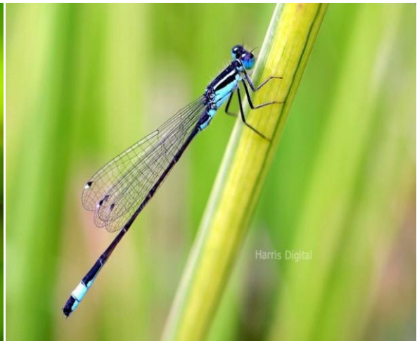
الرعاش الصغير Damselfly